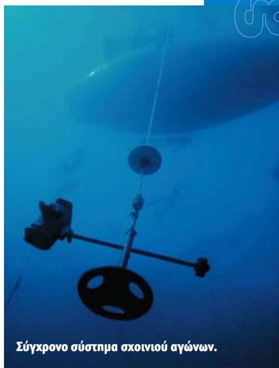
Σύγχρονο σύστημα σκοινογιού αγώνων.