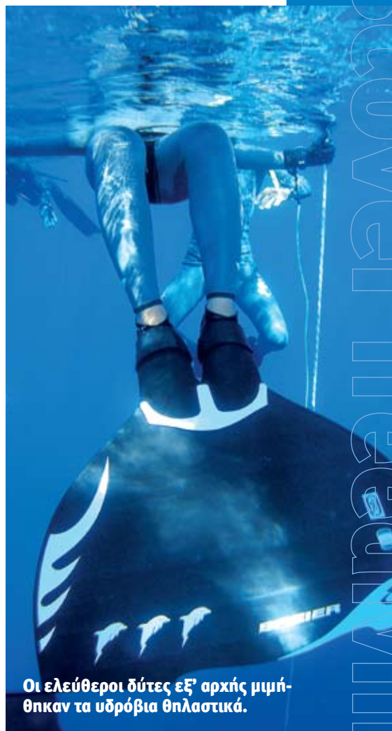
Οι ελεύθεροι δύτες εξ' αρχής μμηθήκαν τα υδρόβια θηλαστικά.