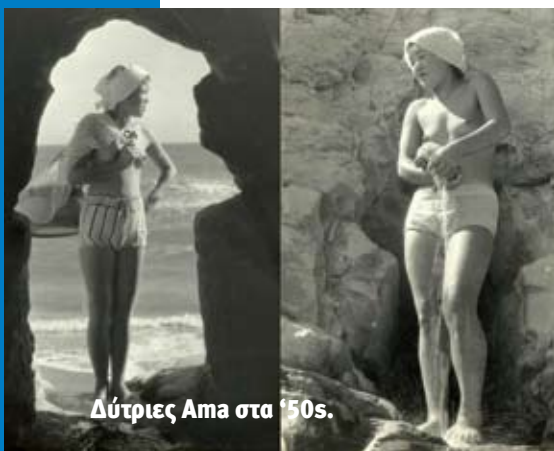
Δύτιρες Αμα στα '50s.